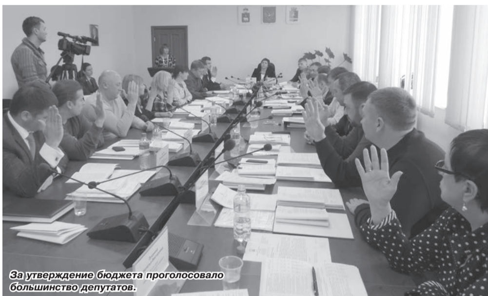
За утверждение бюджета проголосовало большинство депутатов.

19 ноября состоялось очередное пленарное заседание Думы Чайковского городского поселения, на котором присутствовали все двадцать депутатов. Работа предстояла напряжённая, поскольку в повестке числилось 18 вопросов, один из которых особого внимания заслуживал не только самих народных избранников, но и собравшихся на заседании общественных деятелей, жителей города, а также представителей средств массовой информации: вопрос о принятии в первом чтении бюджета города на 2016 год и плановый период 2017 и 2018 годов.