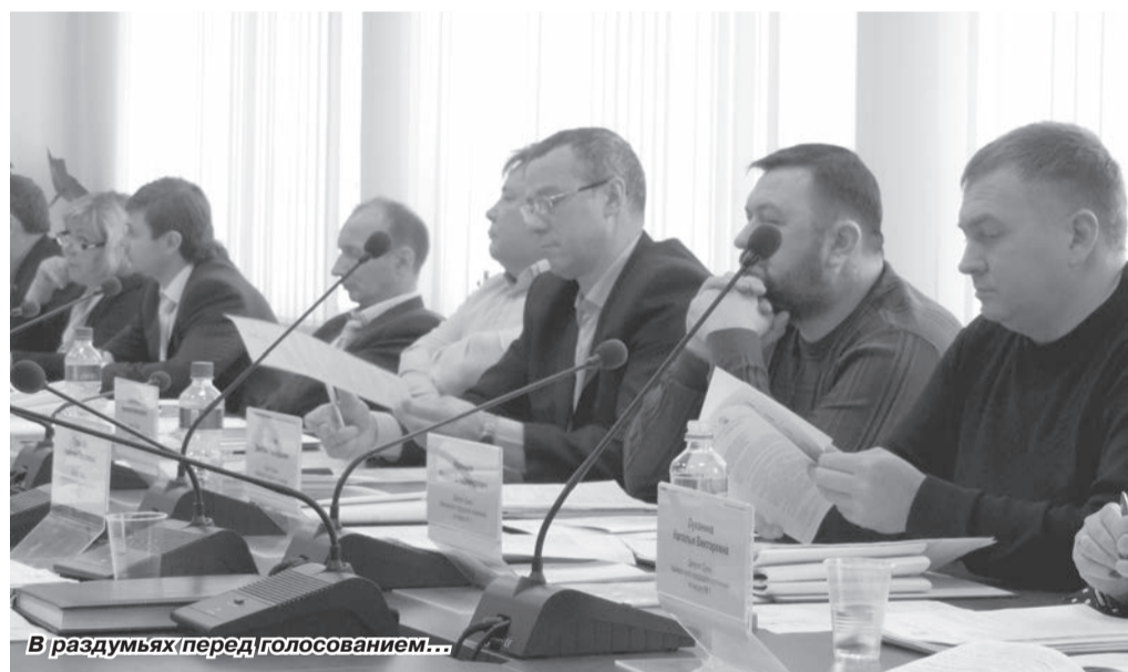
В раздумьях перед голосованием...