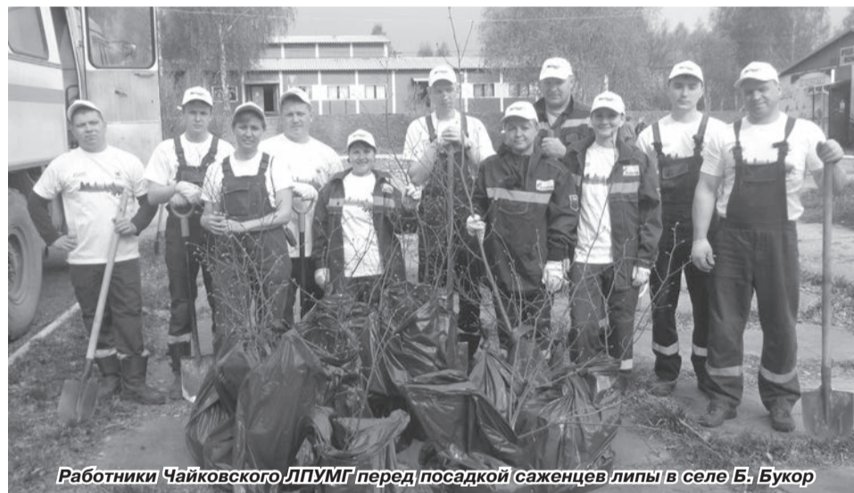
Работники Чайковского ЛПУМГ перед посадкой саженцев липы в селе Б. Букор