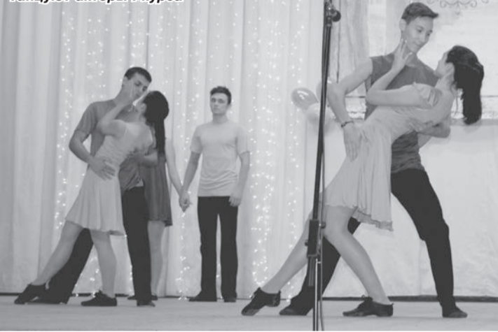
Танцуют актёры I курса