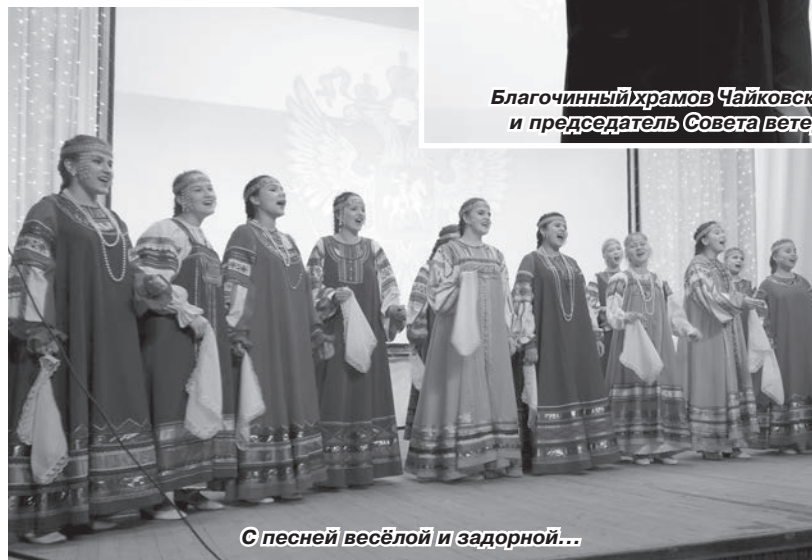
С песней весёлой и задорной...