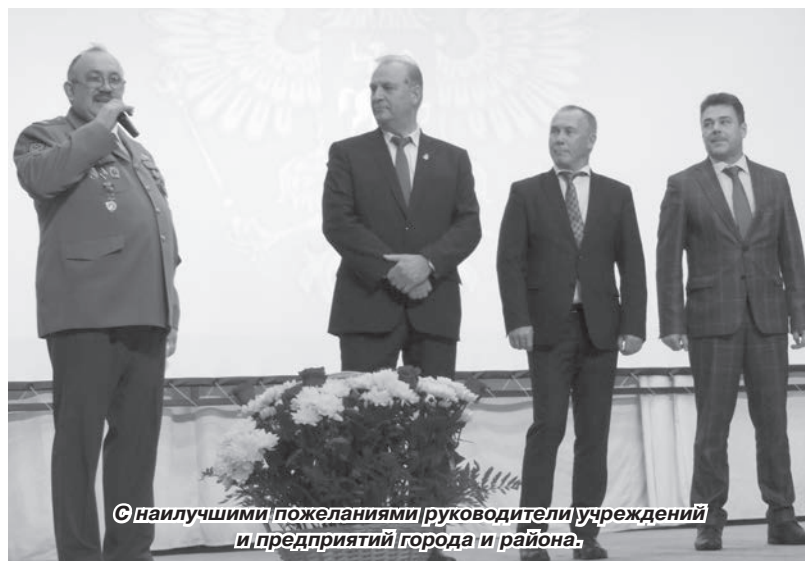
С наилучшими пожеланиями руководители учреждений и предприятий города и района.