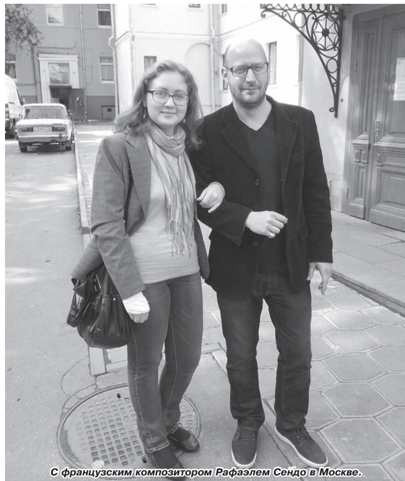
С французским композитором Рафаэлем Сендо в Москве.

Предполагая интенсивность столичной студенческой жизни, всё-таки поинтересовался у Галины