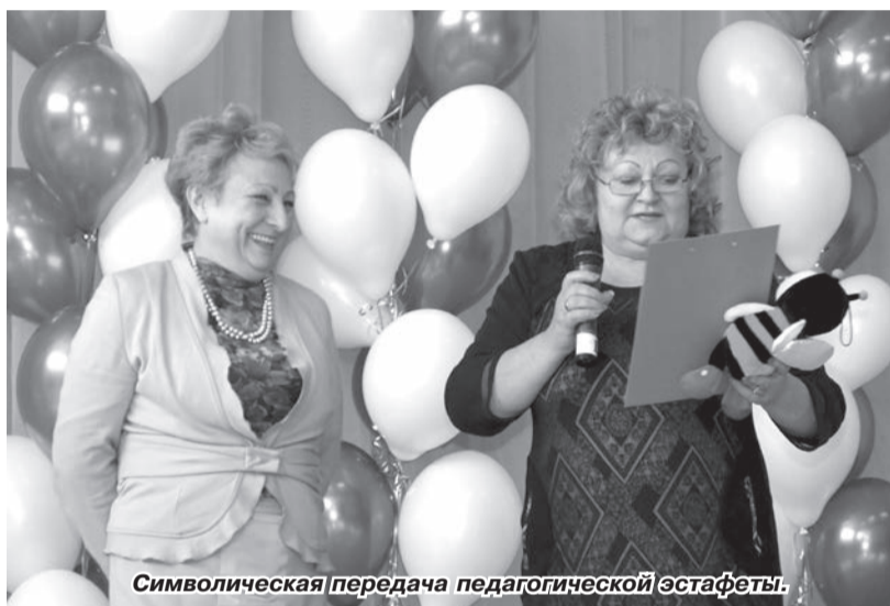
Символическая передача педагогической эстафеты.