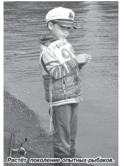
Растёт поколение опытных рыбаков.

Те, кто рыбачили с лодок, доставили на берег рыбы значительно больше, нежели их коллеги с бе-