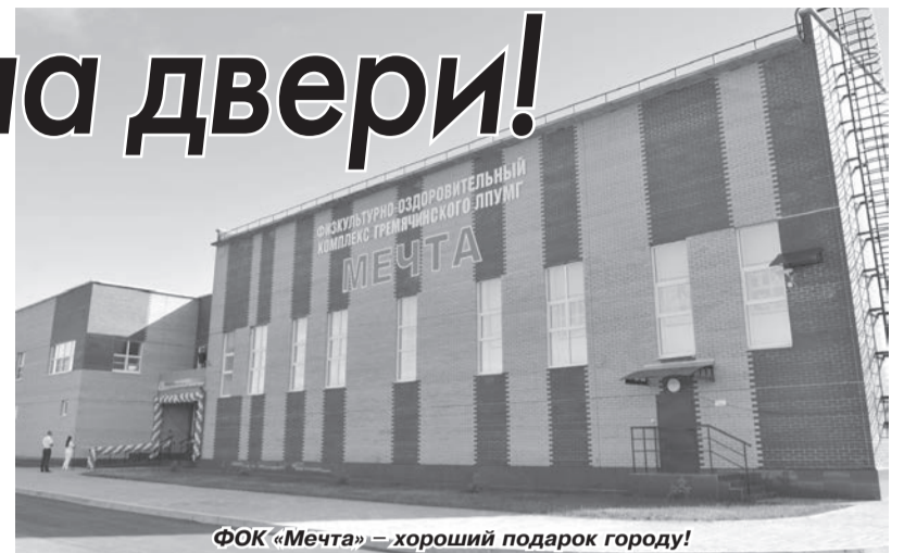
ФОК «Мечта» – хороший подарок городу!

ФОК «Мечта», площадью 1274 кв. м., при максимальной загрузке способен принимать порядка 100 человек в день – серьёзный показатель, если учесть тот факт, что население Гремячинска составляет чуть более 10 тысяч человек. Кроме того, рядом со спорткомплексом сооружены открытая хоккейная коробка, волей-