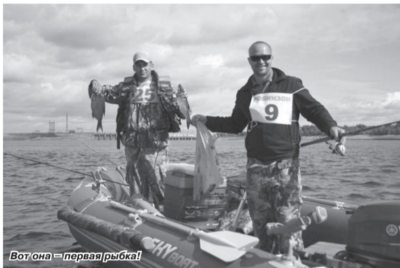
Вот она – первая рыбка!