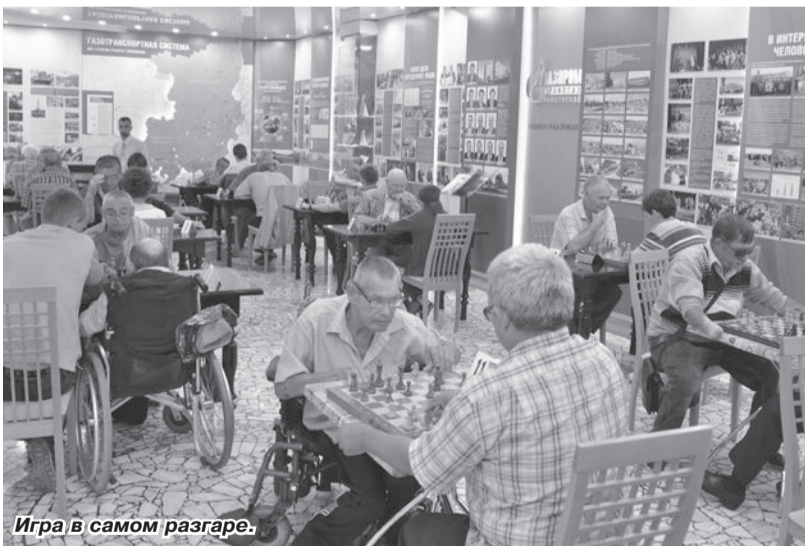
Игра в самом разгаре.