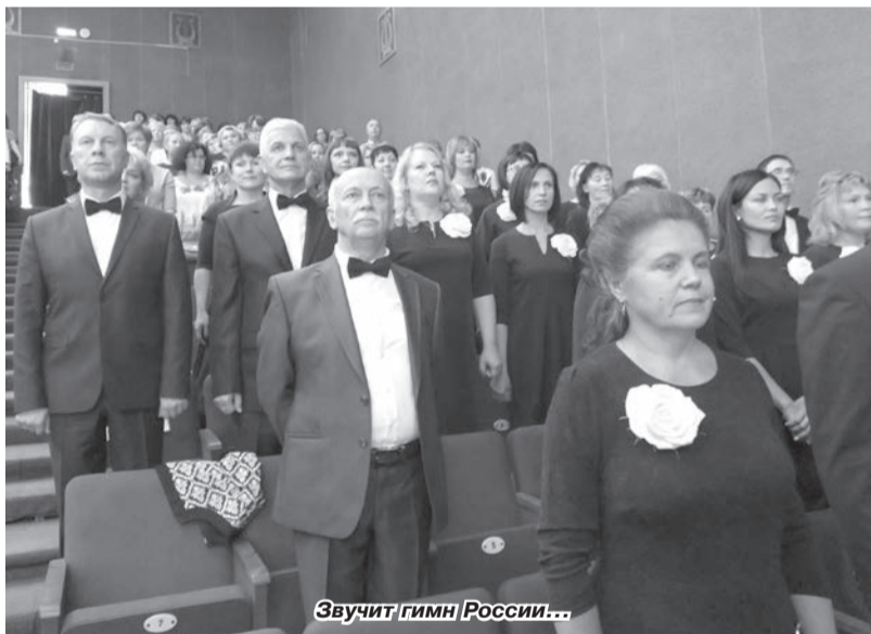
Звучит гимн России...

зания и техническое моделирование. Суть в том, что все планы – в чём-то приземлённые, а порой и очень амбициозные, с первого взгляда простые, но часто трудно выполнимые – разрабатываются с прицелом на будущие достижения детей и динамичное развитие Чайковского муниципального района.