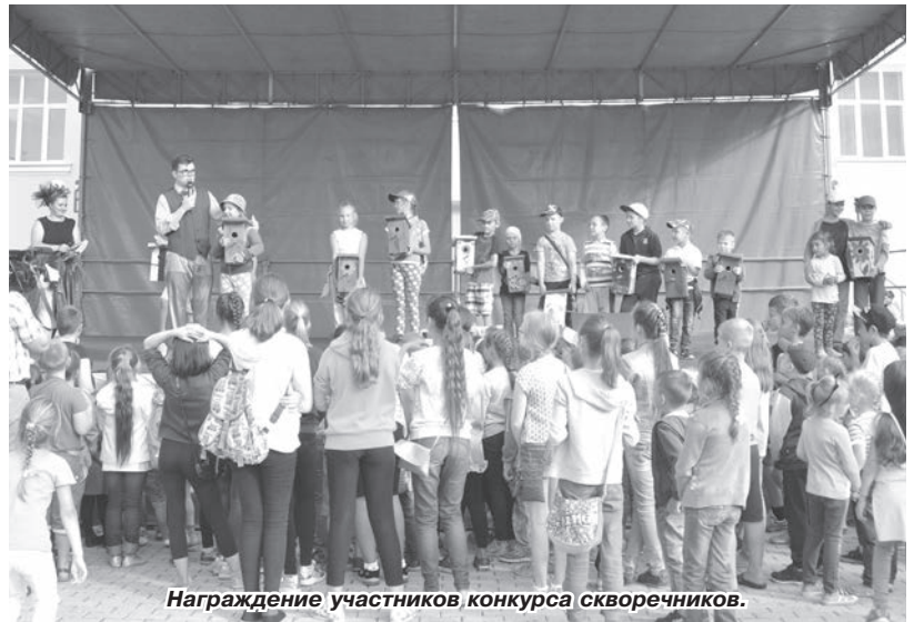
Награждение участников конкурса скворечников.

– Очень признательны организаторам за этот праздник! Сколько