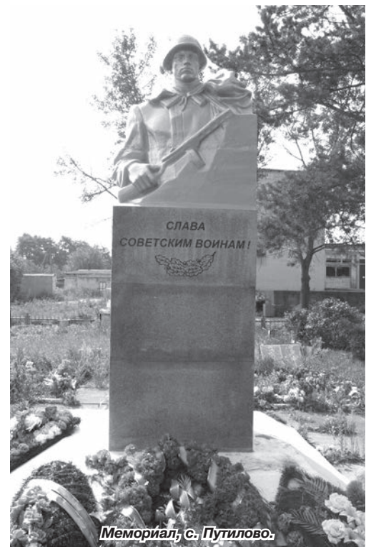
Мемориал, с. Путилово.