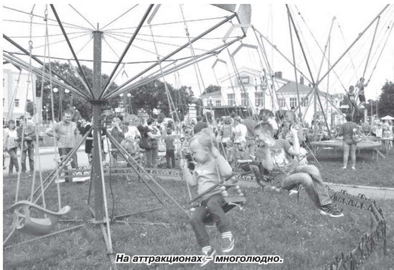
На аттракционах – многолюдно.

По случаю знаменательной даты здесь чествуют первостроителей, активистов микрорайона, старожилов села Сайгатки, положившего начало городу Чайковскому. Им вручают благодарственные письма, памятные сувениры. В этом году организаторы праздника совместно с городской администрацией решили расширить рамки народного гуляния и добавили в