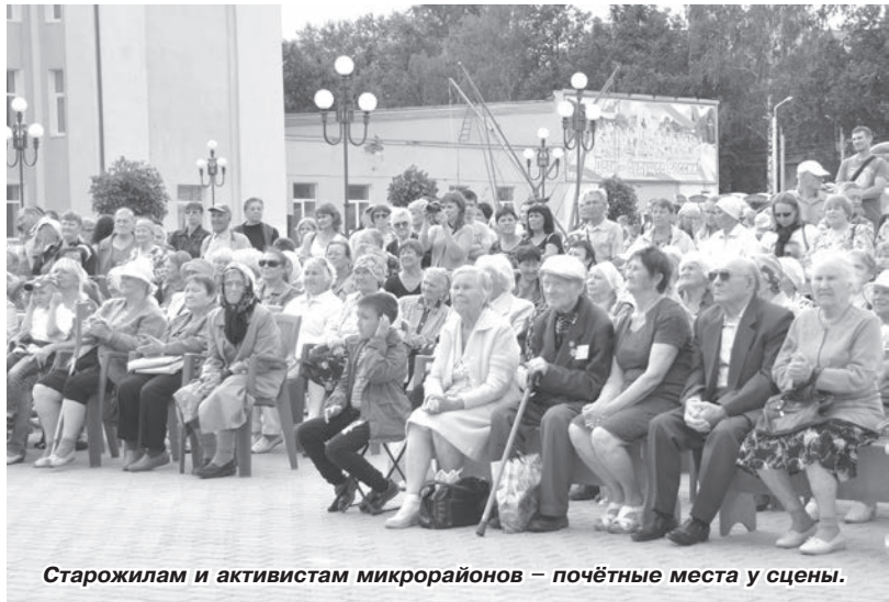
Старожилам и активистам микрорайонов – почётные места у сцены.

Благодаря поддержке газовиков в Чайковском состоялся традиционный праздник «День Сайгатки».