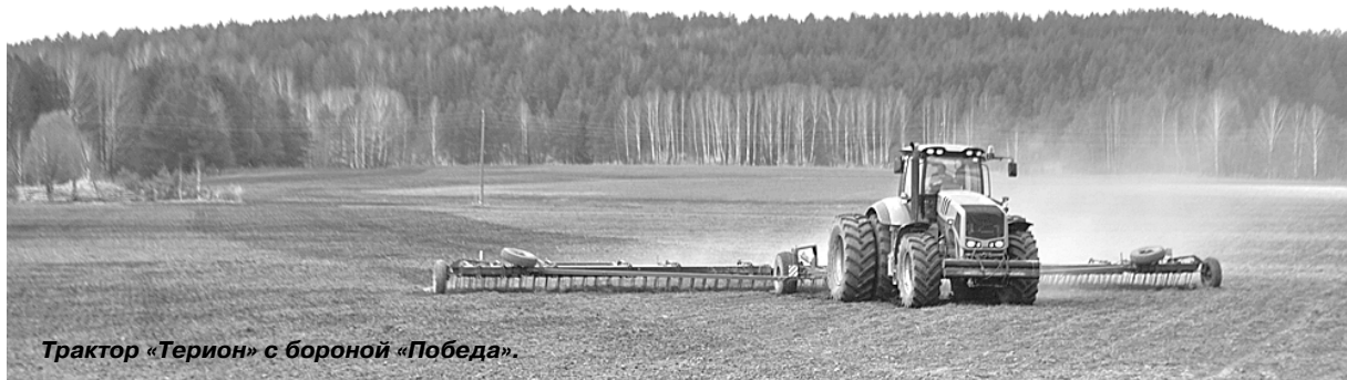
Трактор «Терион» с бороной «Победа».

Впрочем, работы хватит всем 19 механизаторам, которые сегодня заняты на плантациях птицефабрики. Ведь предстоит посеять более 2800 гектаров зернобобовых культур (посеяно на вчерашний день более 500 га), где предпочтение отдаётся пше-