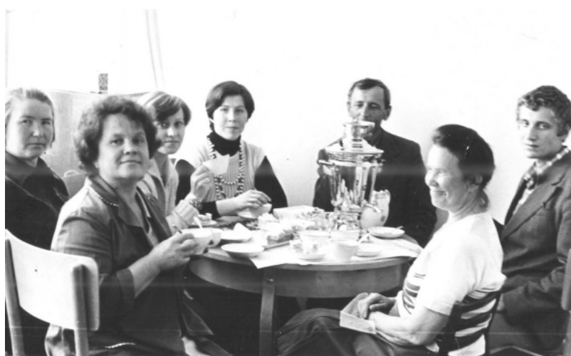
В редакции выдалась свободная минутка...